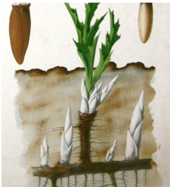
Detaljeret og tilgængelig visuel information

Hvorimod de botaniske, zoologiske og geologiske plancher ikke har nogen tid. Vi kan tænke på Flora Danica.